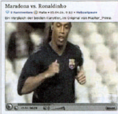
Fooligan präsentiert – unter anderem – interessante Fundstücke, zum Beispiel Zusammenschnitte historischer Fußballmomente.